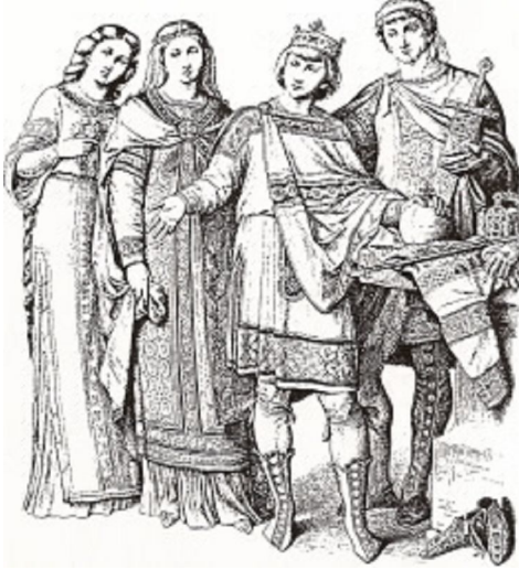
Şekil:3 (G. Serdar.)