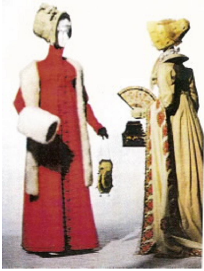
Şekil No: 6 Fransız Kadınlarının Giydikleri Ampir Tarzı Giysilerinde Düğme Kullanımı