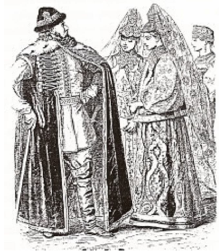
Şekil No: 5 (G. Serdar)