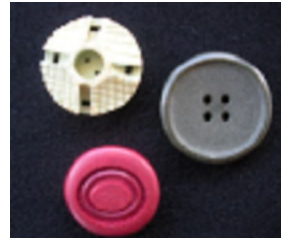
Şekil No: 9 Kemik düğmeler