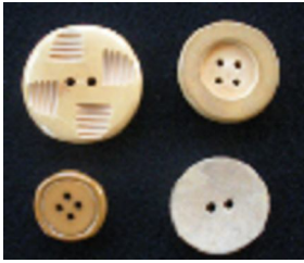
Şekil No: 8 Ahşap düğmeler