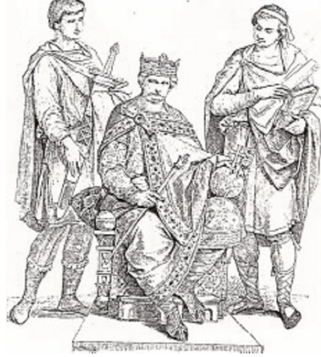
Şekil:4 (G. Serdar)