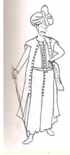
Şekil No: 7 Osmanlı Giysilerinden Düğme Kullanımına Örnekler