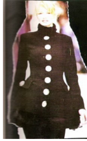
Şekil No:1-2 Düğmenin fonksiyonel ve süsleyici özellikleri