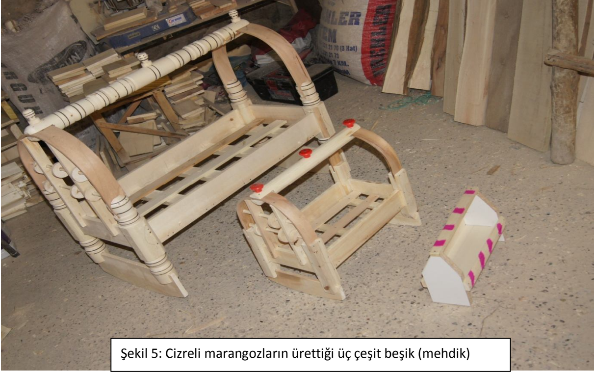
Şekil 5: Cizreli marangozların ürettiği üç çeşit beşik (mehdik)