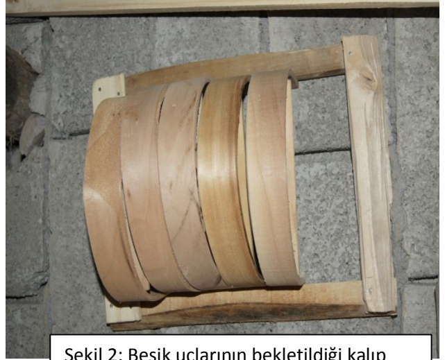
Şekil 2: Beşik uçlarının bekletildiği kalıp