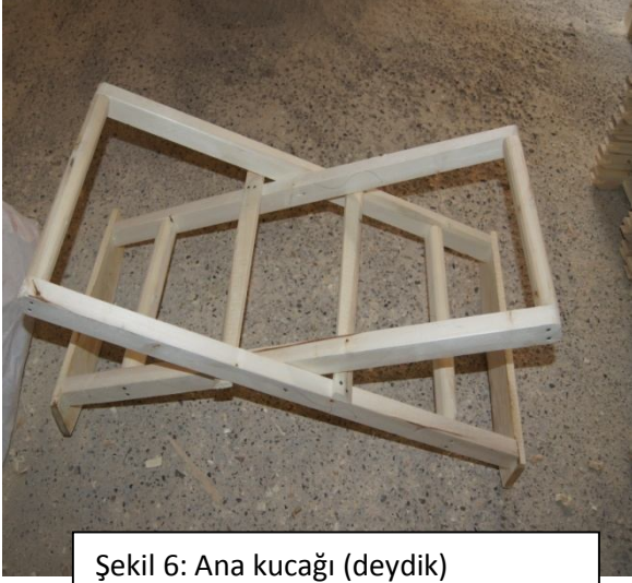
Şekil 6: Ana kucağı (deydik)