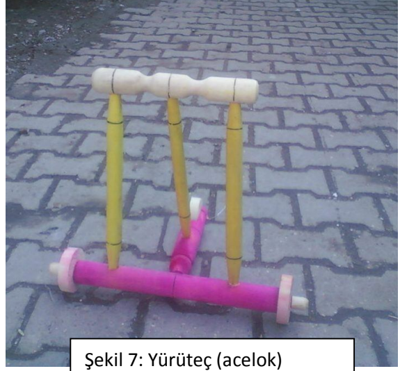
Şekil 7: Yürüteç (acelok)