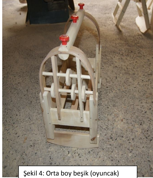
Şekil 4: Orta boy beşik (oyuncak)