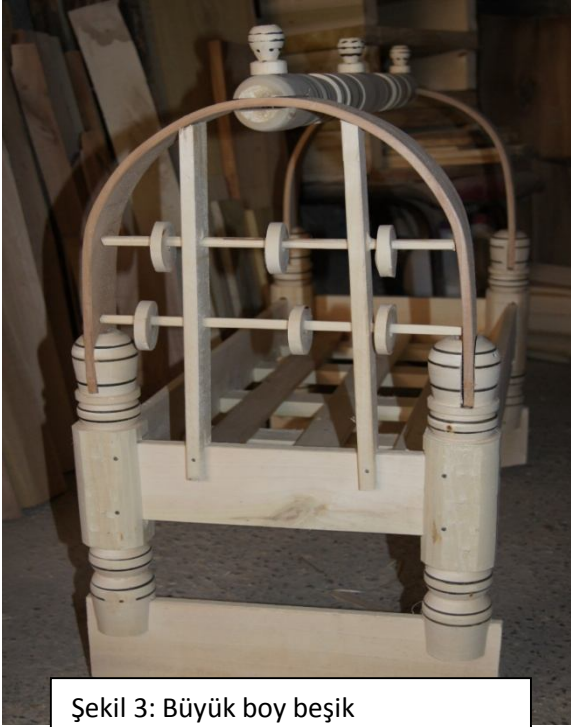
Şekil 3: Büyük boy beşik