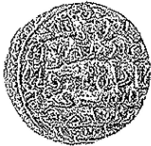
Resim 1: Beypazar darphanesinde Gazan Mahmud adına darbedilmiş gümüş sikke