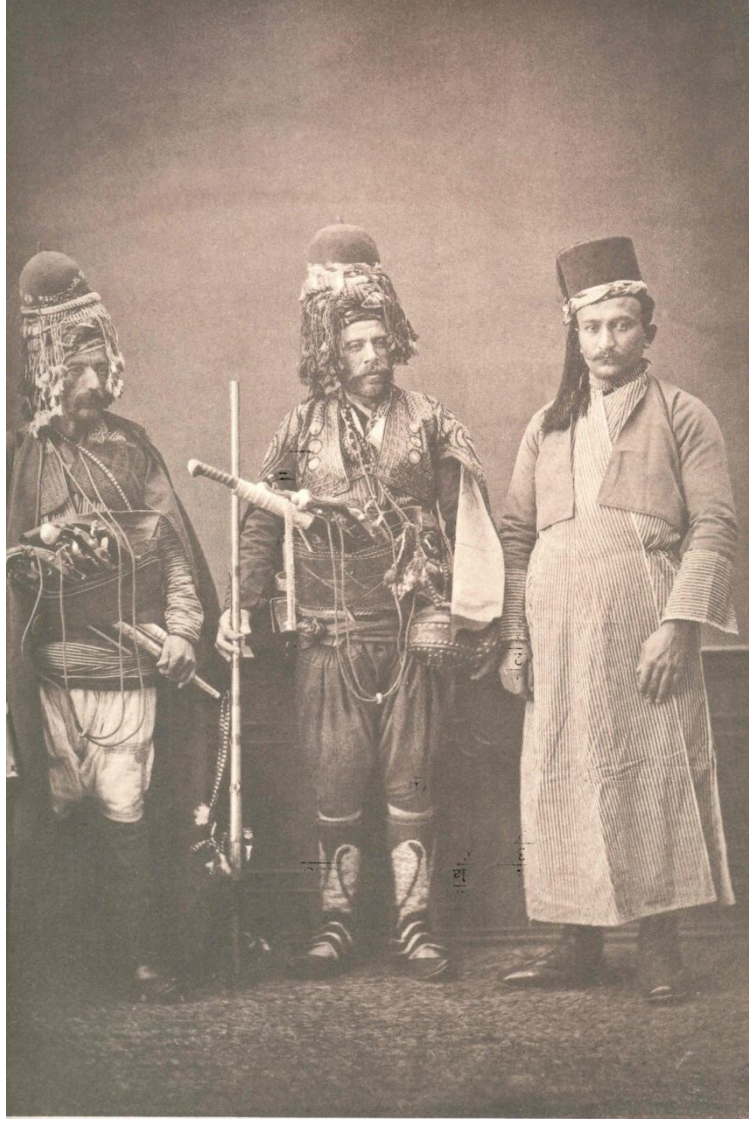
Fotoğraf: Soldan birinci ve ikinci kiři Zeybek, üçüncüsü Aydınlı sanatkârdır (Komisyon 1999: 213).